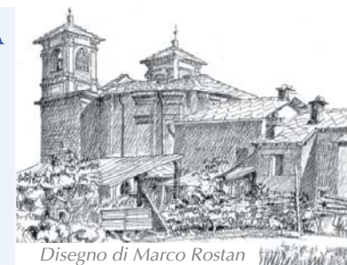
Disegno di Marco Rostan

Diacono: Dario Tron dtron@chiesavaldese.org